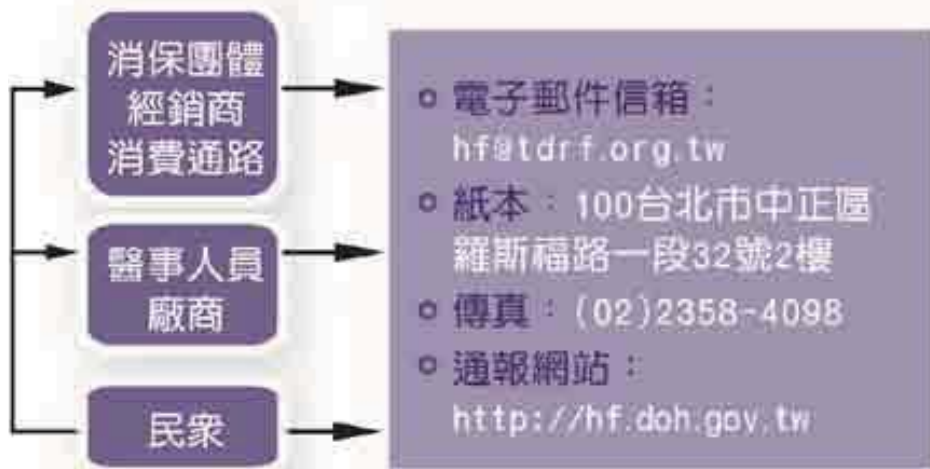
圖三 出自行政院衛生署食品藥物管理局